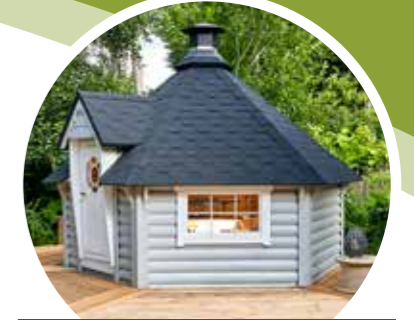
Schöner Blickfang: Grillkota