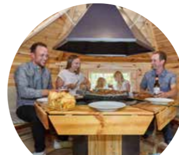
Die Esse sorgt für Rauchabzug