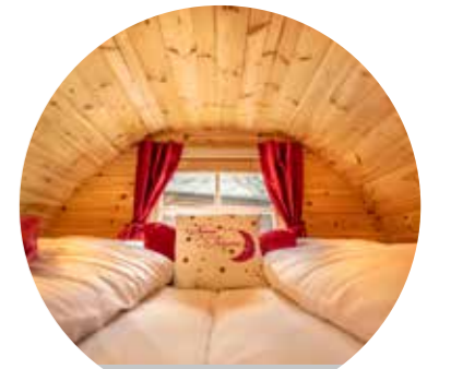
2 m x 2 m großes Familienbett