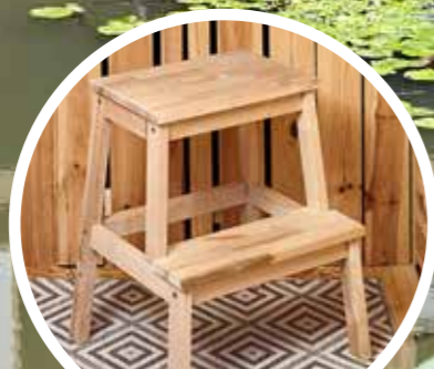
Der Stufenhocker dient als Treppe und Ablagefläche