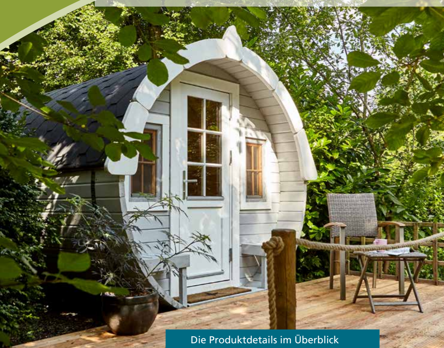
Die Produktdetails im Überblick