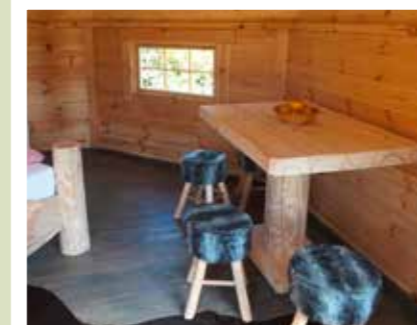
Fotografien Kuschelkota: Ferien- und Campingpark Wisseler See