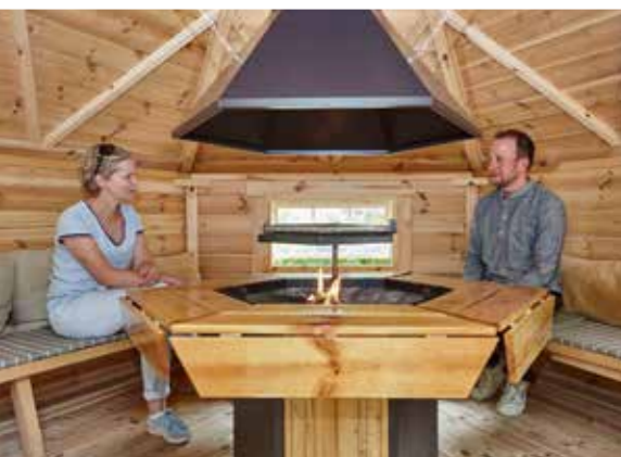
Bis zu 21 Personen finden in der Kota Platz