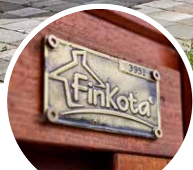
Original Finkota® Markenqualität