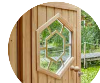
6-eckiges Fenster in der Tür