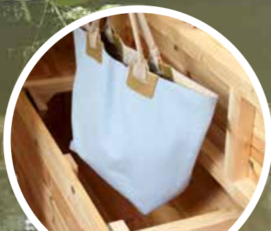
Nützlicher Stauraum in den Sitzbänken