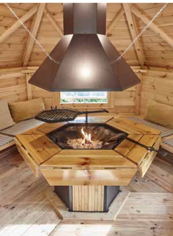
Attraktives Design, hochwertige Fertigung