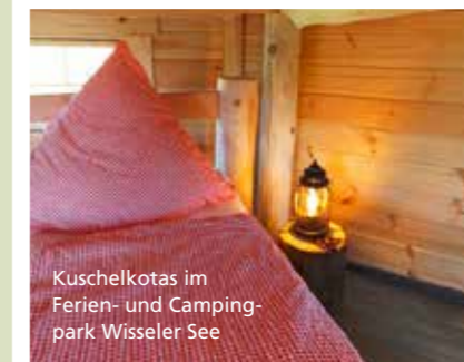
Kuschelkotas im Ferien- und Campingpark Wisseler See