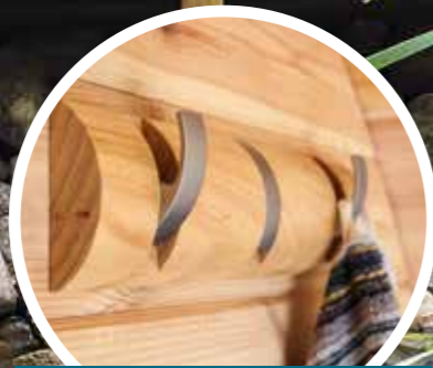
Hochwertige Details aus Massivholz: praktische Wandhaken