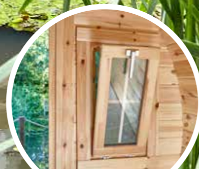
Kippbare Fenster im Schlafbereich und neben der Tür