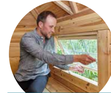
Belüftung durch Kippfenster