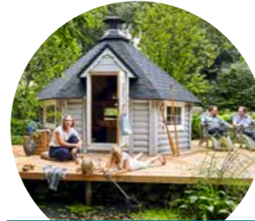
Attraktiv für Ihre Gäste!

Die Original Finkota® Grillhütten werden grundsätzlich als Bausatz auf einer Palette geliefert. Wir empfehlen ein Betonfundament. Eine einfach gehaltene Anleitung unterstützt Sie beim Aufbau. Ein einfaches Schüttdfundamente trägt eine Grillhütte nicht gut und Bodenfrost kann dann zu Spannungsrissen in der Holzkonstruktion führen.