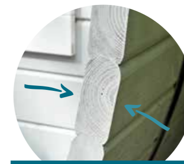
Materialstärke 46 mm