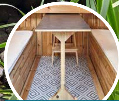
Ausziehbarer Tisch mit stabilem Standfuß